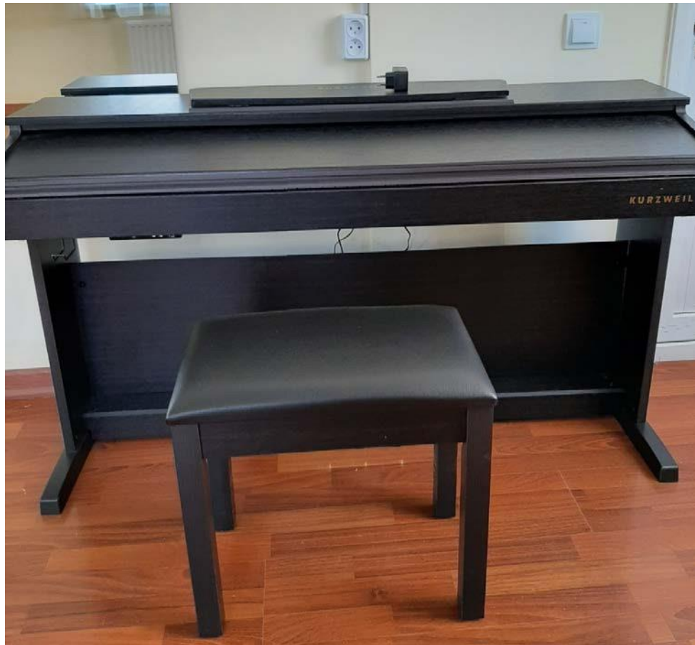
Piano électrique KURZWEIL offert à l'école