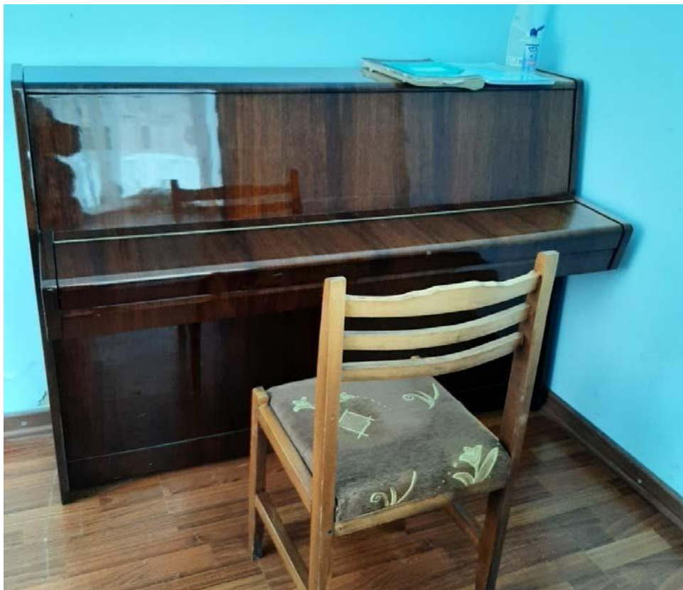
Piano PETROF offert à l'école d'art