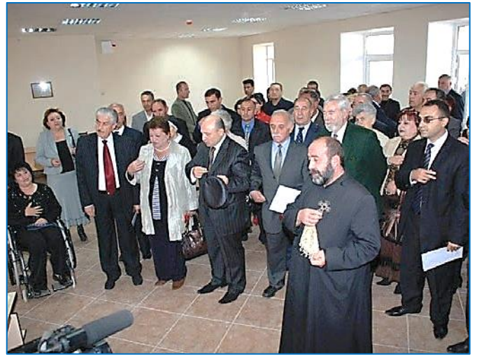
Inauguration de la première tranche en juillet 2008