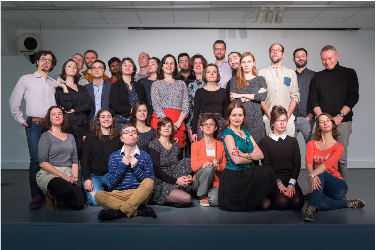
SCRIBE-Paris, saison 2017-2018